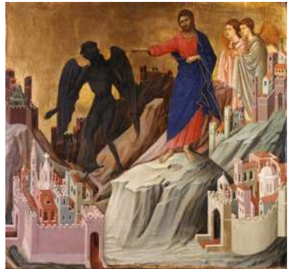
Duccio di Buouinsrgna, La tentazione di Cristo sul monte, oko 1308.-1311.