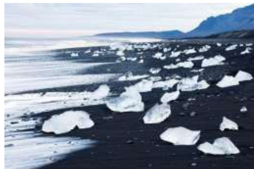
Princ William Strait, Aljaska/SAD

48. Na Novom Zelandu crna je nacionalna boja – njima to je boja naroda/ljudi.