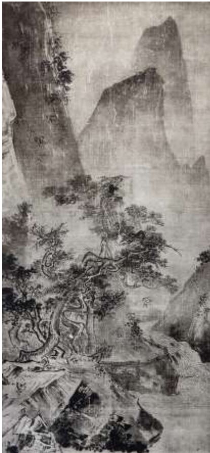
Li Tang: Jesenji pejzaž (cca. 1070.–1150.)