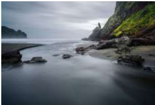
Pina Beach, Novi Zeland