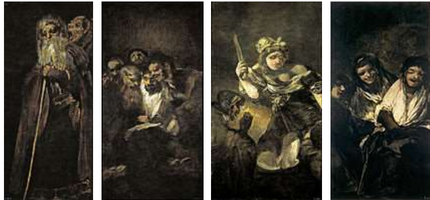
Museo del Prado.

61. Crne slike (španjolski: Pinturas negras ) ime je grupe od četrnaest slika španjolskog slikara Francisca Goye (1746.-1828.) nastalih, vjerojatno, između 1819. i 1823. Prikazuju intenzivne, proganjajuće teme, što odražava njegov straha od ludila i njegov sumorni pogled na čovječanstvo. 1819. godine, u dobi od 72 godine, Goya se uselio u kuću izvan Madrida koja se zvala Quinta del Sordo ( Vila gluhih ljudi ). Iako je kuća dobila ime po prethodnom, gluhonijemom vlasniku, Goya je u to vrijeme bio, također, gotovo potpuno gluhih od posljedica groznice koju je prebolio s 46 godina. Slike su prvobitno bile naslikane na zidovima kuće - poput zidnih fresaka. Kasnije su ih "skinuti" sa zidova i pričvrstiti ih na platnu. Sada su u Madridskom