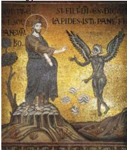
Tentazione di Cristo, mozaik, XII.st., Palermo.