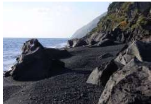
Piscita, Otok Stromboli, Italija