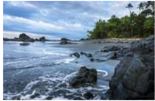
Playa Pavones, Costa Rica