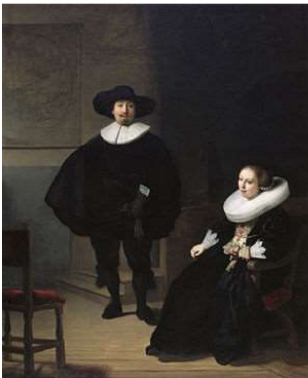
Rembrandt: Dama i gospodin u crnom , 1633.