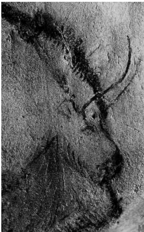
Prahistorijski crtež, 12 000 pr.n.e. - špilja Niaux, Francuska

45. Kao i prije tisuće godine i danas je u upotrebi kao crtača tehnika koju odlikuje svježina i neposrednost, kakve nema u obojanim umjetničkim djelima.