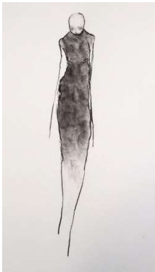
Felix Dolah, Absolute

46. Ovom krajoliku crnu boju daje prirodno željezo. Na površini Zemlje prirodno željezo je samo izuzetno u elementarnom stanju (telurno željezo na otoku Disko, zapadno od Grenlanda).