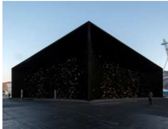
paviljon – najcrnju crnu zgradu na svijetu: