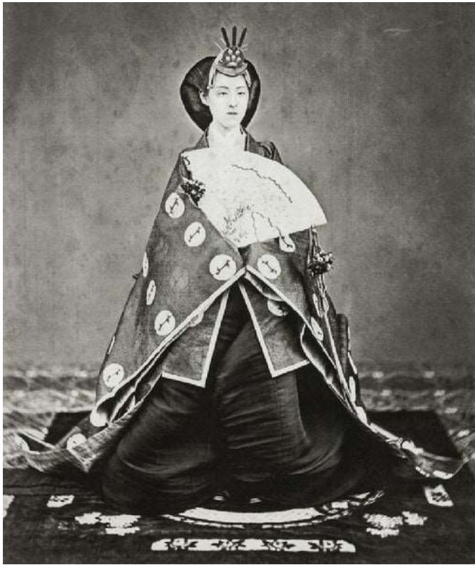
Haruho, japanska carica, 1873. u carskoj odori

Fotografija: Uchida Kyuich, pionir japanske fotografije, bio je prvi i jedini fotograf kojemu je bilo dopušteno fotografirati carsku obitelj.