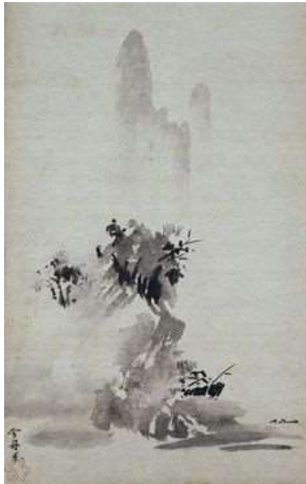
Haboku sansui, 1495.